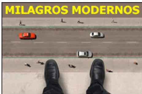
Por Rav Benjamin Blech

En cada momento, podemos revelar a Dios ya sea identificándolo o emulándolo. Nuestros modelos son la Reina Ester apuntando con su dedo, y la anciana bajando sus bolsas. No tenemos que ser un personaje ilustre para revelar a Dios en este mundo.